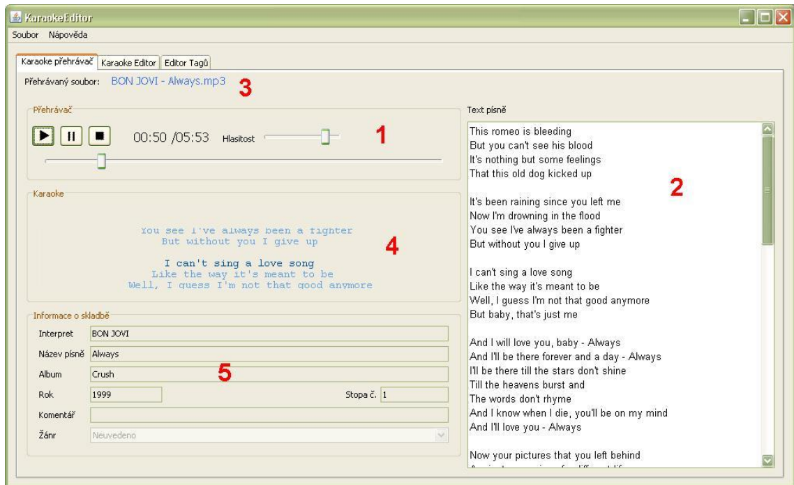
Obr. 3 - Přehrávání karaoke

Klikněte na Soubor -> Otevřít a vyberte píseň, kterou chcete přehrát. Otevřený soubor je zobrazený vlevo nahoře (3). Po otevření se ihned spustí přehrávání písně. V části Karaoke přehrávač (1) jsou tlačítka pro základní ovládání přehrávání (Play, Stop, Pause), odehraný čas, délka skladby a posuvník pro ovládání hlasitosti.